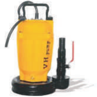
VH-40LAS • SUCCIONADORA DEJA MAXIMO 1 mm DE ESPEJO DE AGUA

Bomba succionadora, para bombeo de agua con residuos de grasa y comida en cocinas de restaurantes, hoteles, comedores, hospitales, hogares, cafeterías, etc. Con válvula fácil de usar.