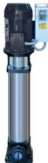
EVMSG equipada con variador de frecuencia industrial.

Las conexiones estándar son las bridas redondas, ver modelos de bomba. Para otro tipo de conexión, consultar.