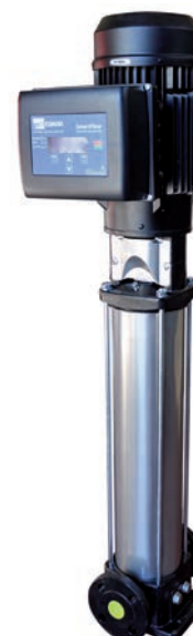
EVMSG equipada con variador "E-SPD".