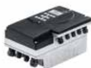
Automatización con PumpDrive