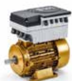
Motor KSB SuPremE®- disponible previa petición